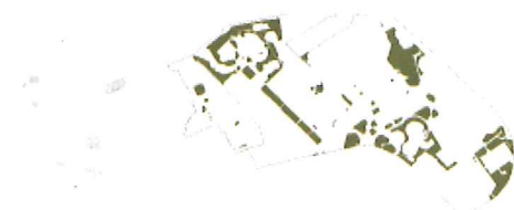
MEGLÉVŐ ÁLLAPOT összes aktív zöldfelület: