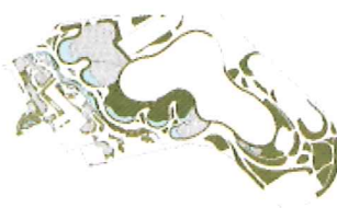
CSAK KÜLSŐ összes aktív zöldfelület: