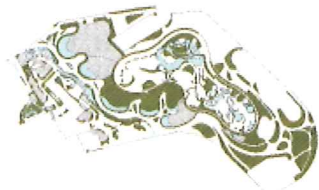
KÜLSŐ-BELSŐ IS összes aktív zöldfelület: